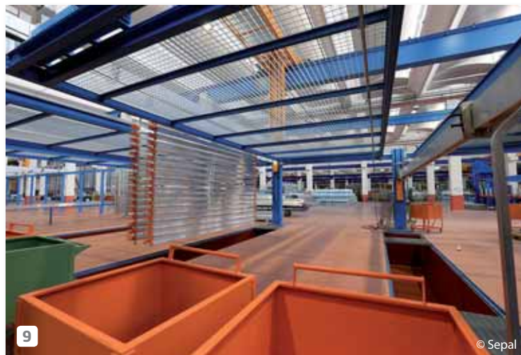
9 The loading area of the oxidation plant.

Il moderno impianto di ossidazione anodica.