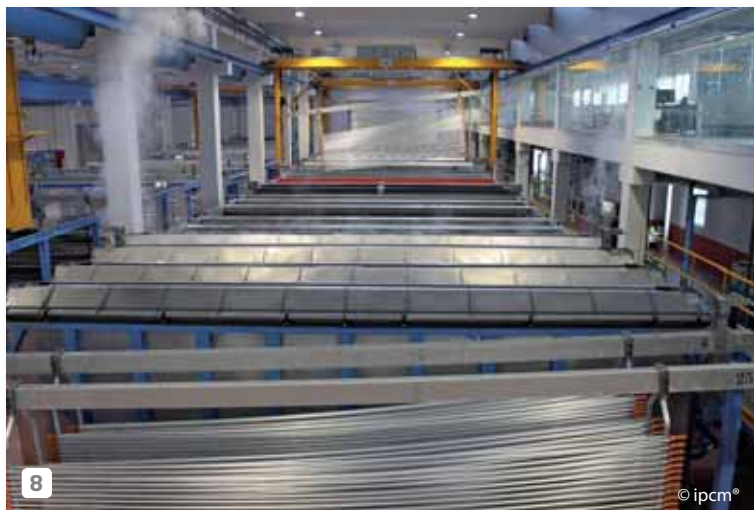
8 The modern anodic oxidation system.

Il moderno impianto di ossidazione anodica.