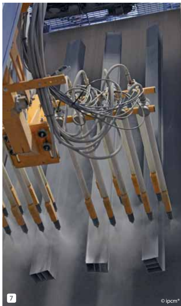
7 The powder application stage in one of the two vertical booths. La fase d'applicazione delle polveri in una delle due cabine verticali.

station consisting of two tanks ( Figs. 4 and 5 ) After the flash oxidation process, the profiles return to the tunnel for a cleaning stage with demineralised water, followed by a drying stage in the firing kiln and by the coating, curing and packaging phases.