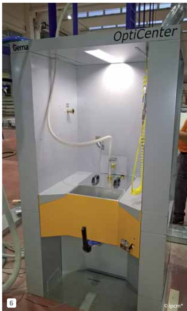
6 The powder centre manufactured by Gema. Il Powder Center di Gema.